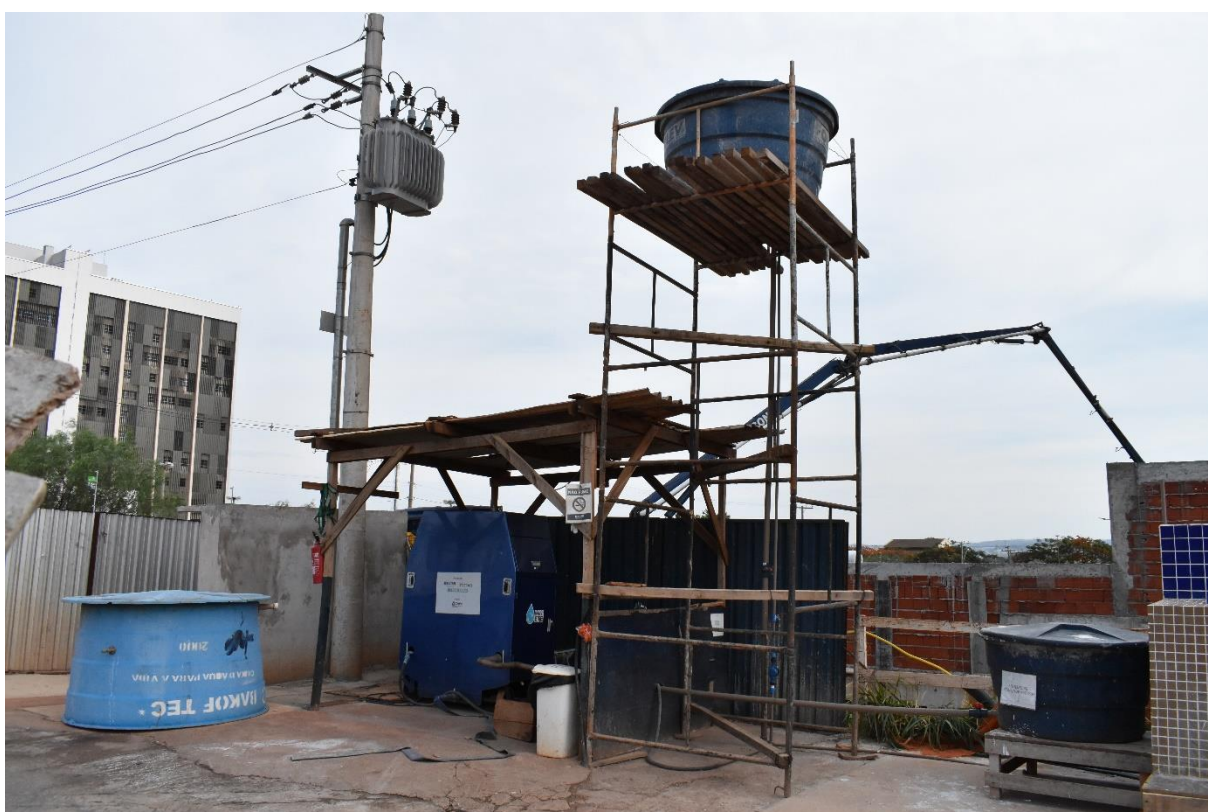
Figura 5: Mini-ETE da Empresa 2.

Ainda nesta entrevista, foram apresentadas formas de manuseio consciente de água, como o reaproveitamento de água de chuva, de ar condicionado, ou de torneiras, que podem gerar economia em fases construtivas da obra que utilizem água sem necessidade de potabilidade, ou em partes do canteiro como o lava-rodas, descargas sanitárias, na irrigação da horta, entre outros. Para isso, a obra conta com uma mini-ETE (mini estação de tratamento de efluente), que está representada na Figura 5.