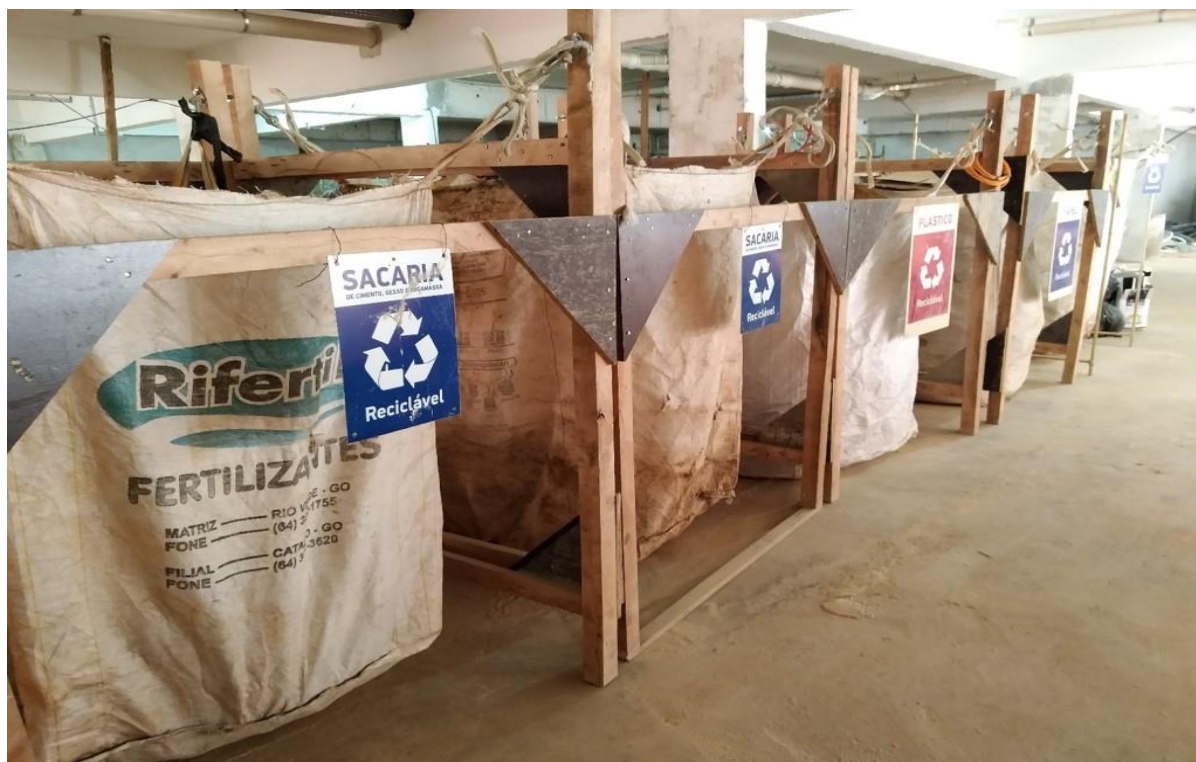
Figura 3: Central de Resíduos da Empresa 2.

Outro item importante visto nos procedimentos construtivos das duas empresas foi o solicitado pelo item 3.18 da norma, que trata da prevenção de poluição. Esta prática é adotada nas duas empresas sob forma de várias ações, como de reaproveitamento de materiais sempre que possível, desde itens de ferramentas, até decoração e outros itens do canteiro; a segregação dos resíduos separadamente, para possibilitar o reaproveitamento, a reciclagem, a destinação para empresas parceiras que apresentem alguma utilidade para o material, ou até a venda dos mesmos. Esta segregação pode ser observada na Figura 3, que apresenta a central de resíduos da Empresa 2.