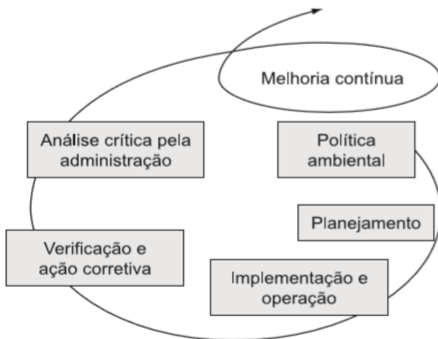
Figura 2: Espiral do Sistema de Gestão Ambiental. Fonte: ISO 14001 (2004)

Um exemplo disso é que foi citado o processo de melhoria contínua e ação corretiva (Figura 2), referentes aos tópicos 3.2 e 3.3 da norma, pelas duas gestões das empresas. Segundo os entrevistados, suas equipes desenvolvem alternativas a partir de sugestões de todos os envolvidos, experimentam em campo, depois corrigem as falhas e mantêm os processos bem-sucedidos, preservando a inovação e a análise.