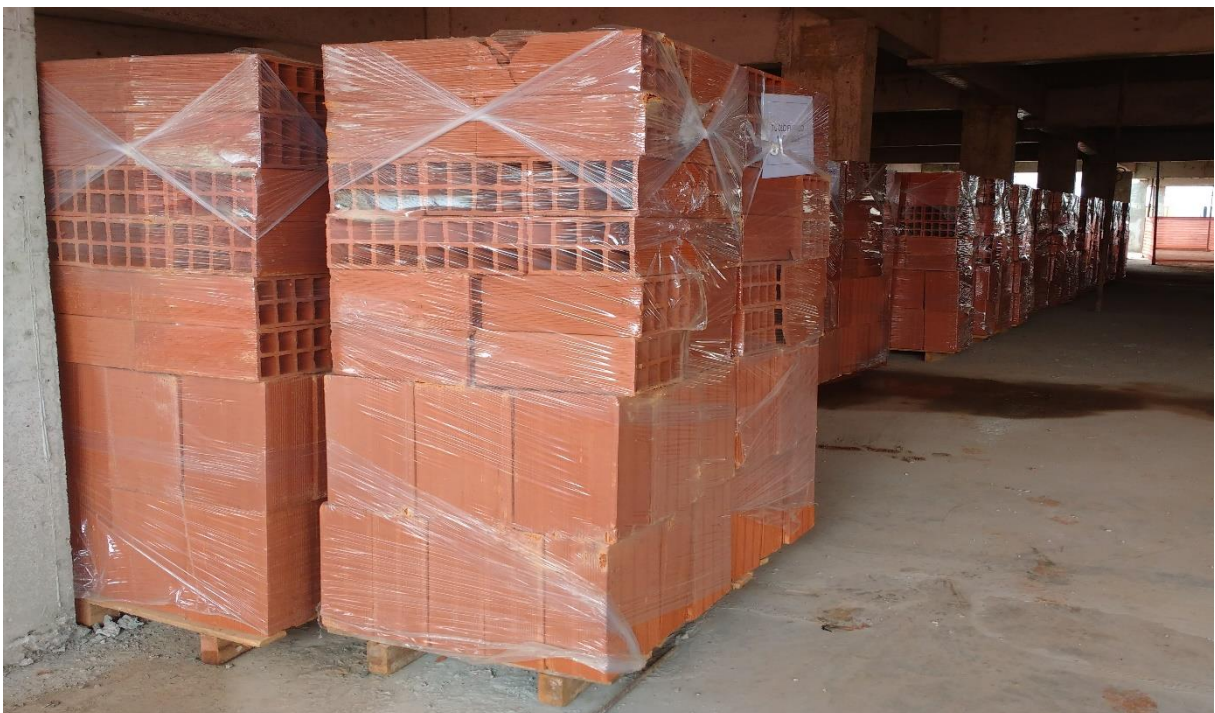
Figura 4: Tijolos Paletizados da Empresa 2.

A prevenção da poluição pode incluir redução ou eliminação de fontes de poluição, alterações de processo, produto ou serviço, uso eficiente de recursos, materiais e substituição de energia, reutilização, recuperação, reciclagem, regeneração e tratamento. (ISO 14001:2004, p.4).