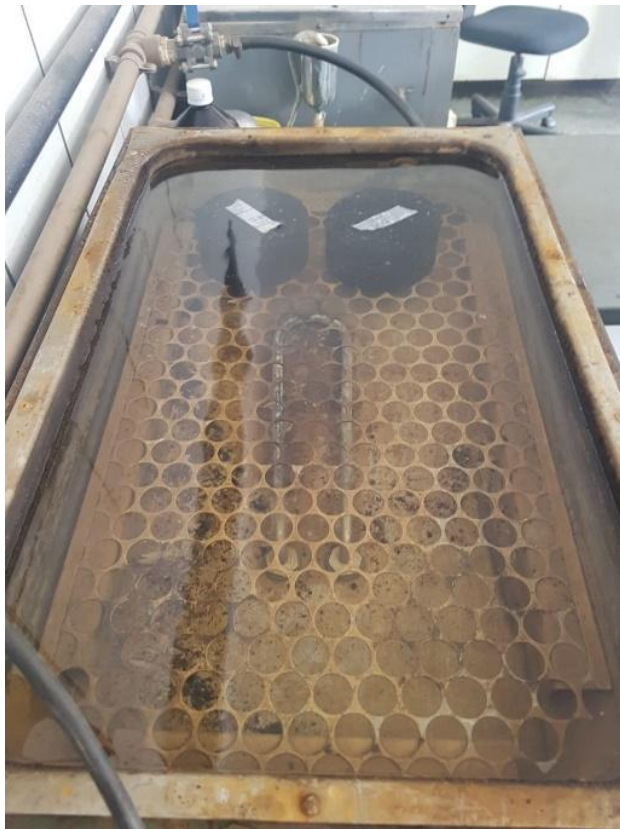
Figura 8: Corpos de Prova em Água