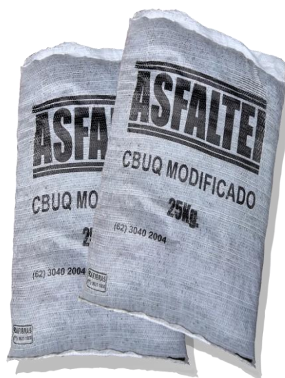
Figura 2: CBUQ modificado