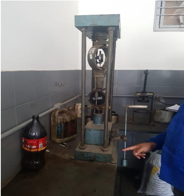
Figura 7: Prensa Hidraulica