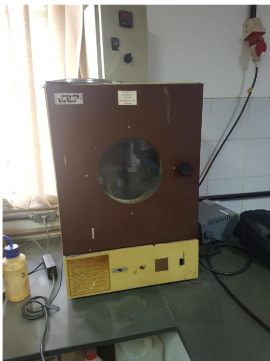
Figura 3: Estufa

Realizou-se, segundo a norma 153/2010-es DNIT, o preparo do PMF utilizando como agregado brita zero e areia artificial, adicionando emulsão de ruptura media, mais comum para o tipo de situação em análise no estudo, e finalizado com a mistura dos componentes. Esse material foi exposto para um período de cura de 4 horas e em seguida foram elaborados os corpos de prova com massa de 1,200 quilogramas e após isso colocou-se em estufa (Figura 3) os três corpos de prova do PMF a 60 graus por 24 horas (Figura 4).