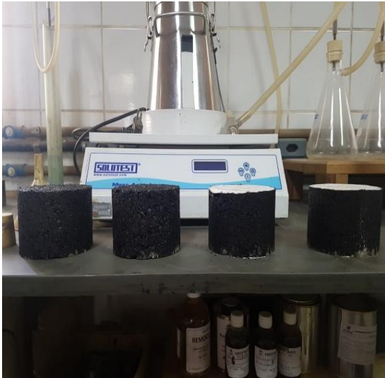
Figura 5 :Corpos de Prova desmoldados