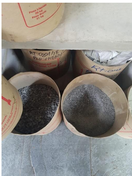
Figura 1: Agregados usados no PMF

A distribuidora da fabricante do asfalto ensacado em estudo disponibilizou o CBUQ modificado não emulsionado em uma embalagem de 25 quilogramas (Figura 2), assim como é revendido por eles, com teor de concreto asfáltico de petróleo (CAP) de 5,26%. Já o PMF fora fornecido pela própria Disbral e realizado no próprio laboratório da empresa, sendo um PMF aberto e com teor de CAP de 5% e 8% de emulsão (Figura 1). O experimento em que os materiais foram submetidos para comparação foi o de resistência a tração por compressão diametral, regido pela norma 136/2010 do DNIT, sendo assim para o experimento foram elaborados três corpos de prova de cada material, número mínimo determinado pela norma.