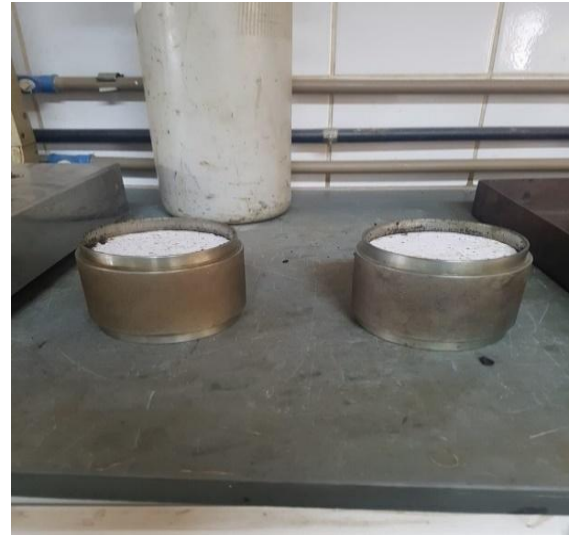
Figura 6 : Corpos de Prova antes de desmoldar

Após o apontamento dessas médias os corpos de prova do CBUQ modificado não emulsionado e do PMF, os mesmos foram deixados em água quente a 40 graus por 30 minutos (Figura 8) e em seguida colocou-se os corpos de prova na prensa mecânica (Figura 7) com sensibilidade de 19,6 Newton e aplicou-se carga progressiva com velocidade de deformação de 0,8 \pm 0,1 mm/s até que ocorra ruptura do corpo de prova separando as duas partes de acordo com plano diametral vertical, e atingiu-se assim a carga de ruptura do corpo de prova, determinada no anel dinamométrico. Os resultados obtidos de carga de ruptura foram utilizados para calcular a resistência do corpo de prova aplicando na formula: \sigma R = \frac{2F}{100 \pi DH} onde; \sigma R é a resistência a tração em kgf, F é a carga de ruptura em Newton, D o diâmetro do corpo de prova em centímetro e H é a altura do corpo de prova em centímetro. Foi estabelecido então a resistência dos corpos de prova de cada material.