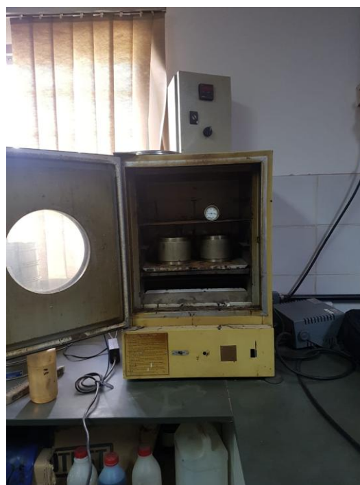
Figura 4: Corpos de Prova em Estufa

Posteriormente os seis corpos de prova foram retirados das formas (Figura 6) e colocados ao ar livre por 6 horas. Seguiu-se então para o experimento de determinação da estabilidade dos materiais através da compressão diametral de misturas asfálticas segundo a norma DNIT 136/2010, então passado esse período pesou-se todos os corpos de prova ao ar e imerso em água para determinação da porcentagem de vazios de cada, mediu-se a altura do corpo de prova com paquímetro em quatro posições equidistantes e determinou-se o valor da altura pela média aritmética das quatro alturas. Para o diâmetro mediu-se o corpo de prova em três posições paralelas e determinou-se a média dos três diâmetros para ser utilizada para os cálculos do experimento.