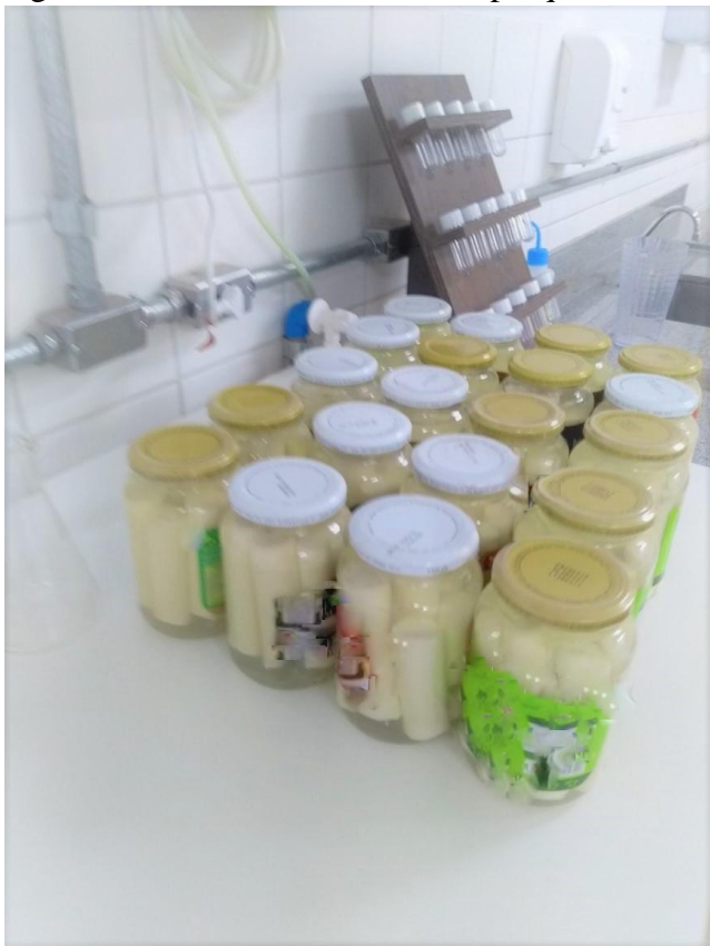
Figura 01 Amostras analisadas na pesquisa.